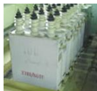
高圧コンデンサー