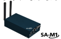
高圧のスマートメーターとクラウドを結びつける端末「SA-M1」

従来のデマンド監視システムとは異なり、Bルートを利用することでゲートウェイ機器の設置作業のみで簡単に利用を開始でき、パルスを利用した従来型よりも低コストで導入を実現します。これまで導入が難しかった中小規模な需要家の方にもご利用いただけます。